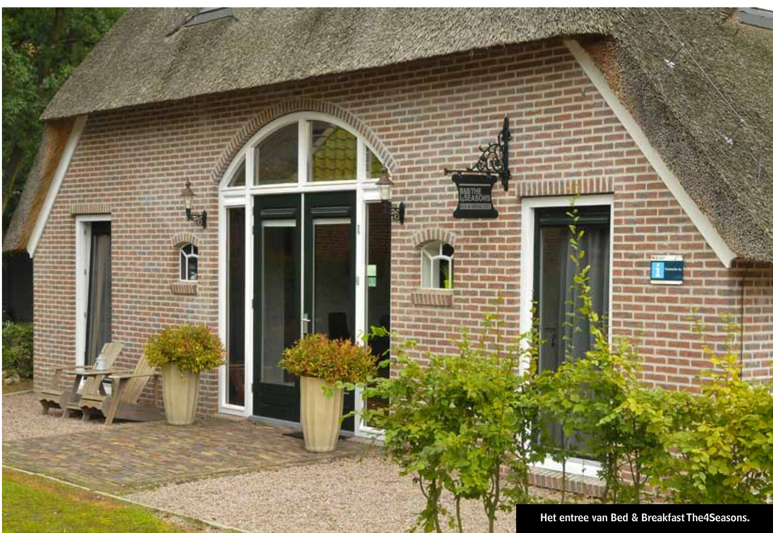
Het entree van Bed & Breakfast The4Seasons.

Judith heeft veel informatie over de omgeving beschikbaar, maar als hoogtepunten noemt zij o.a. de vele wandel- en fietsmogelijkheden (bijvoorbeeld Pieterpad) in de omgeving. Eén van de wandelroutes die door ons dorp loopt is de zogenaamde knapzakroute. Cultuurlief- en shophebbers gaan graag naar Assen of Groningen, maar de natuur van Drenthe is ook prachtig, zoals het beek- en esdorpenlandschap van het nationaal park De Drentsche Aa, het Balloërveld vol heide en de Gasterse duinen met heide- en stuifzandgebieden. Overigens hoeven gasten Loon niet te verlaten voor het diner. Aan de overkant zit Herberg van Loon met divers lekkers op de menukaart.