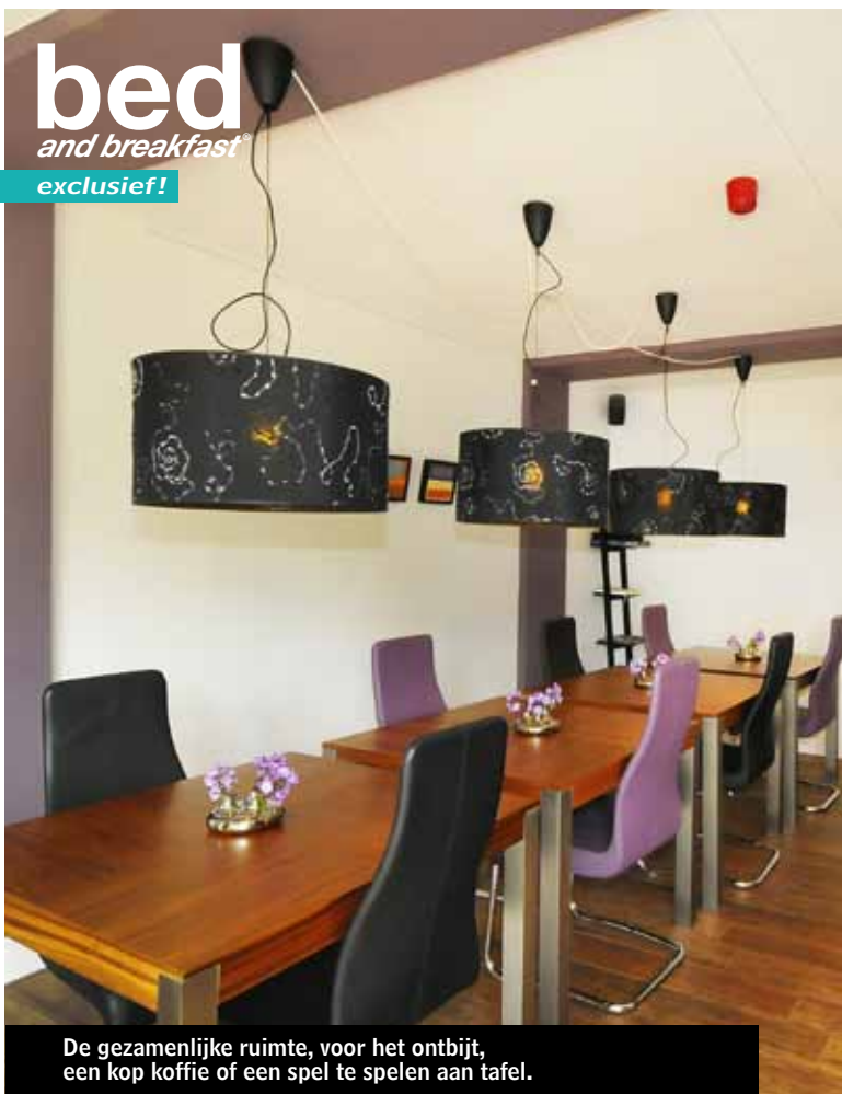
De gezamenlijke ruimte, voor het ontbijt, een kop koffie of een spel te spelen aan tafel.