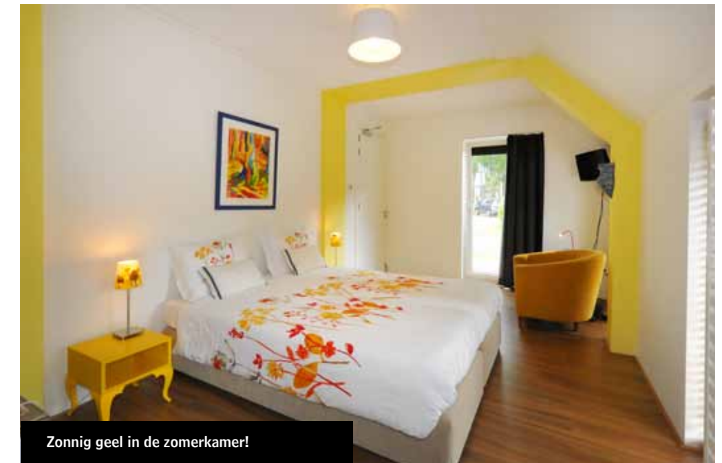
Zonnig geel in de zomerkamer!

“De kamers stralen ieder de sfeer uit van één van de seizoenen. Dit komt onder andere tot uitdrukking in de kleuren. Ik vind het ook erg leuk om te zoeken naar bijzondere seizoens accessoires. De zomerkamer, op de begane grond, is geel. De andere kamer op de begane grond is de lentekamer in lentegroen. Op de eerste verdieping hebben we de