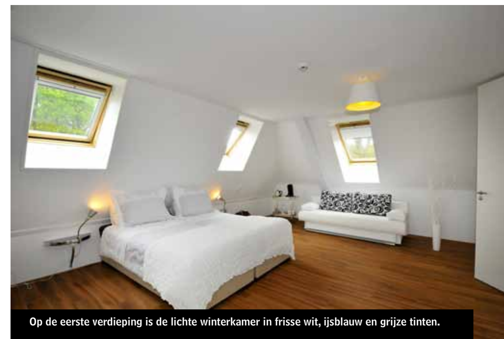
Op de eerste verdieping is de lichte winterkamer in frisse wit, ijsblauw en grijze tinten.

herfstkamer in natuur tinten en de winterkamer in wit, ijsblauw en grijs. Alle kamers hebben een eigen, moderne badkamer met douche en toilet. Hier is het thema van de seizoenen ook terug te vinden. Bovendien hoor ik vaak dat mensen hier erg prettig slapen, dankzij de comfortabele extra lange boxspringmatrassen (1-persoons). Verder is er op iedere kamer een televisie en draadloos netwerk.”